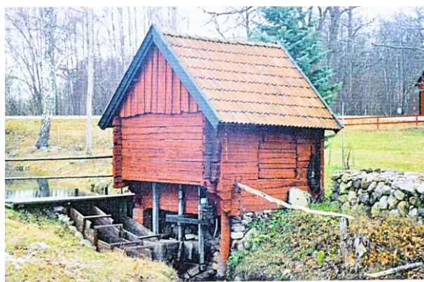
Skvaltkvarnen vid Kristvalla g:a prästgård.

Innan vi fick indelta soldater rekryterades de genom att socknarna indelades i rotar där från varje rote uttogs en man till knekt (mantal = antalet man). För att finansiera kriget mot Polen infördes år 1625 en kvarntull. Det var en avgift för all mald säd. De som malde hemma på handkvarnar skulle ange hur mycket som malts av varje sädeslag. Det inbjöd till fusk och handkvarnar förbjöds 1627. Men bönderna fick behålla handkvarnarna om de i stället betalade en avgift för varje hushållsmedlem över 12 år. Från och med 1628 finns det längder, kvarntullsmantalslängder, över dem som skulle betala denna mantalsavgift. Den s.k. mantalspenningen levde kvar ända till 1863.