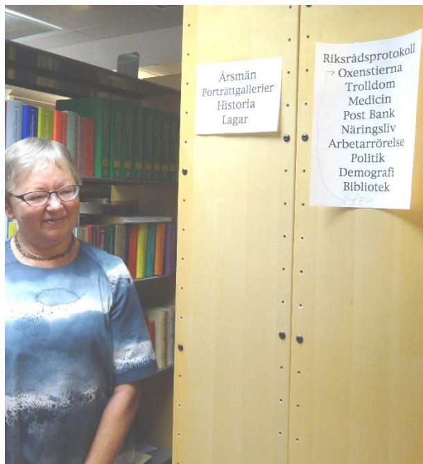
Exempel på ämnesområden