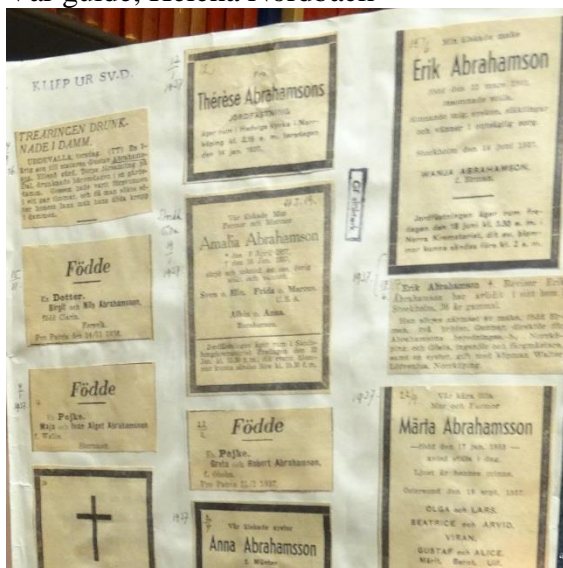
Ur klipparkivets notiser