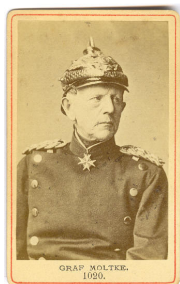
Helmuth von Molke

År 1881 hade den då 81-årige och ryktbare tyske generalfältmarskalken och greven Helmuth von Moltke fått en inbjudan från Oskar II att besöka Stockholm. Resan kom till stånd i augusti, och på morgonen den 10 anlände den prominenta gästen med ordinarie snälltåget från Malmö. Han tog in på Grand Hotel och avreste senare på eftermiddagen i kungligt fyrspänt ekipage till Drottningholm. Där togs han emot av kung Oskar och drottning Sofia, som bjöd honom på middag - och logi, eftersom han fick bo i en våning på slottet på Lovön. Att Moltke togs emot kungligt bevisas bl.a. av att han skjutsades omkring på såväl land som vatten i ömsom hovvagn ömsom kungsslup. Och det var med den senare, Sköldmön, som han besåg Vaxholm och inloppet till Stockholm.