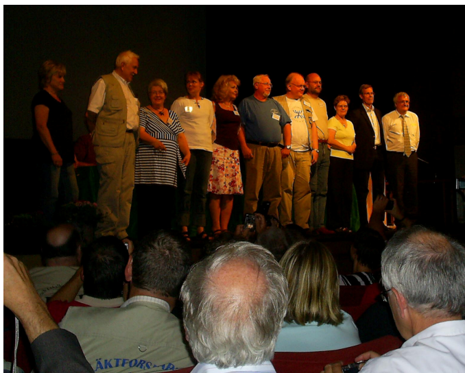
Bilden visar den nyvalda styrelsen.

Efter lunchen var det så dags för årets stämma. Trots den korta dagordningen blev det en långsliten historia som tog över tre timmar. Anledningen till detta var en mycket lång och livlig debatt vad gäller förbundets dåliga ekonomi. Först efter omröstning, med röstsiffrorna 89 för, 52 mot och 10 nedlagda, beslutade stämman att bevilja styrelsen ansvarsfrihet för verksamhetsåret 2006. Eftersom förbundet har en hyreskostnad på ca 120.000 kronor per månad håller man på att se över möjligheterna att, inom en snar framtid, byta till billigare lokaler.