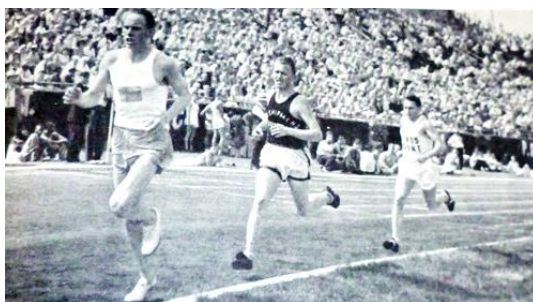
Hägg främst och Greg Rice trea.

Låt oss börja från slutet: sommaren 1943 var, som jag minns den, varm och fylld av härliga upplevelser med sol, bad och myggor. Det fina med att vara 13 år och ledig från skolan var, att man fick vara uppe nästan hur länge som helst. Det var krig ute i världen, men den stora snackisen här hemma i Sverige var de s.k. "Hägg-vakorna". Det var sena direktsändningar i radion, där man per kortvåg, mitt i natten kunde få följa med hur löparstjärnan Gunder Hägg firade triumfer under sin turné runt om i USA. Han var ju stor här hemma och skulle bli det även i Amerika, menade man. Han togs över Atlanten per båt, anlände i mitten av juni till New York och genomförde åtta bejublade tävlingar från kust till kust. Den första utsändningen skedde den 20 juni. Hägg vann samtliga och lade därmed USA för sina snabba fötter. Huvudmotståndaren var amerikanen Greg Rice.