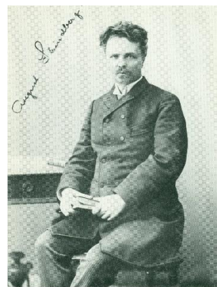
Strindberg bisten 1890.

Det var då, som jag för första gången fick veta "sanningen" om dessa mina förfäders släktskap med varandra. Mitt intresse för att forska vidare väcktes. Ett av skälen var naturligtvis den tillgänglighet, som då fanns genom att mina intressen rörde sådant, som fanns just på Uppsala landsarkiv