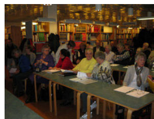
Bild från höstmötet 2009

Som du ser på bilden till vänster så har jag även lagt in en bildtext. Här måste du dock bevaka en funktion om du vill att text och bild inte skall komma alltför långt från varandra. Markera textrutan och låt markören synas i den samt högerklicka. Leta upp menyalternativet ”Stycke...” och klicka där. I rutan som dyker upp är det ”Avstånd” du skall kolla igenom och anpassa tills du blir nöjd. Med avstånd menar man extra tomrum före eller efter text, i detta fall även bilden. Du kan dock inte bara markera bilden, för då vet inte Word att det är textfunktioner du skall