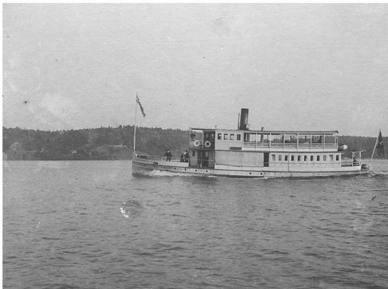
Lidingö II på väg mot Gåshaga och alla bryggorna i Kyrkviken fram till Hustegaholm. Bilden är tagen 1907-10 då ångaren hade detta namn. 1911 övertogs hon av Breviksbolaget och fick namnet Elfvik.

1918, men därefter flyttades ångaren till södra skärgården, med trafik bl a till Tyresö Brevik, Dalarö och traden genom Kolström till Ingarö och Örsundet.