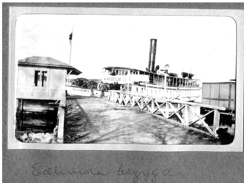
Waxholm II lägger till vid Edlunda brygga på Östra Granholmen en solig men troligen kall dag omkring 1915. Lägg märke till brygghuset som finns kvar än idag, med kepsen på taket och samma typ av fönsterluster. Men huset är flyttat till andra sidan och vridet ett kvarts varv.

Men det var främst Ulfs farfar John Tysén som stod bakom kameran, och det redan på 1910-talet. Ulf berättar: Efter mina föräldrar tog jag hand om ganska många fotoalbum, även sådana som övertagits från deras föräldrar. Min barndoms album hade jag ju sett förut, men jag roades av att bläddra i de från 1900-talets början. Kulturhistoria, hus, transportmedel och miljöbilder som kommit med på familjebildderna. Nyligen har jag botaniserat bland de lösa fotografierna och även där funnit en del ångbåtar.